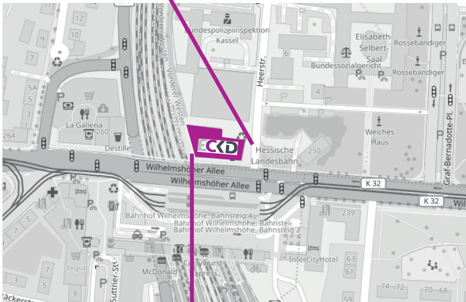
ECKD Event- und Tagungszentrum Kassel Wilhelmshöher Alle 256, 34119 Kassel

Heerstraße / Ecke Wilhelmshöher Allee in 34119 Kassel