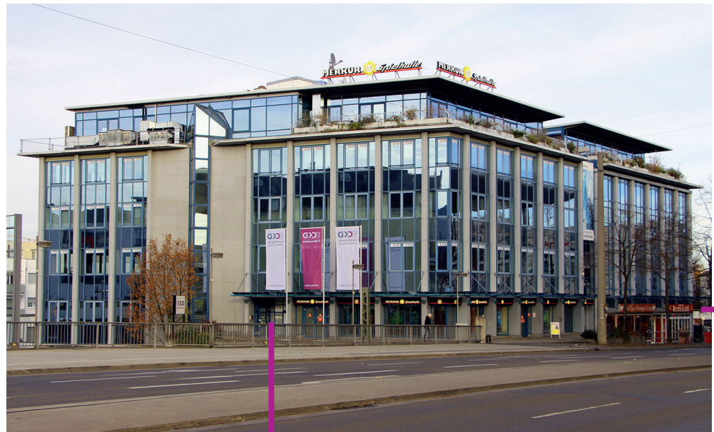
Eingang auf der linken Seite (Ansicht von der Wilhelmshöher Allee)